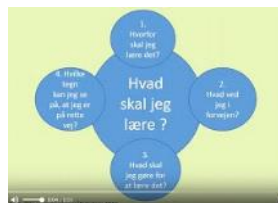
Video med vejledning til første kontaktlærersamtale - KLIK HER .

Hvor høj er din motivation for at gennemføre denne uddannelse (sæt kryds)